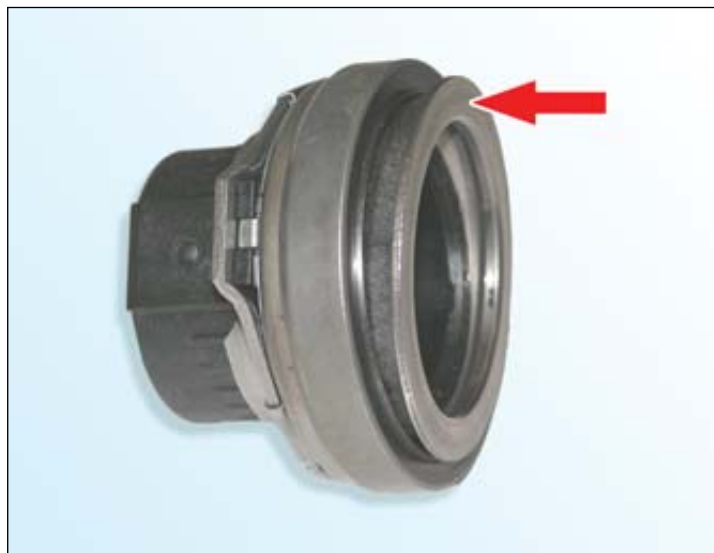
Slika 1: 500 0035 10